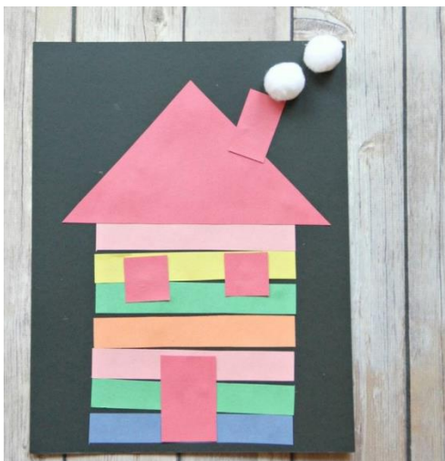
MAVRIČNA HIŠICA IZ TRAKOV PAPIRJA