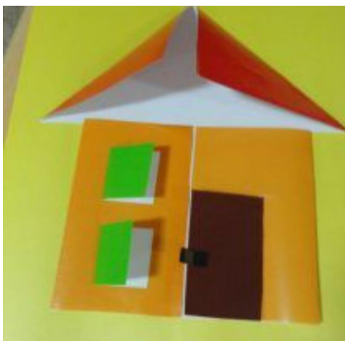
ZGIBANKA IZ PAPIRJA