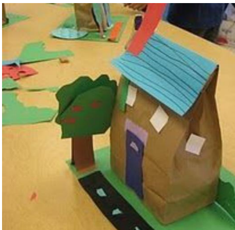
HIŠICA IZ PAPIRNATE VREČKE