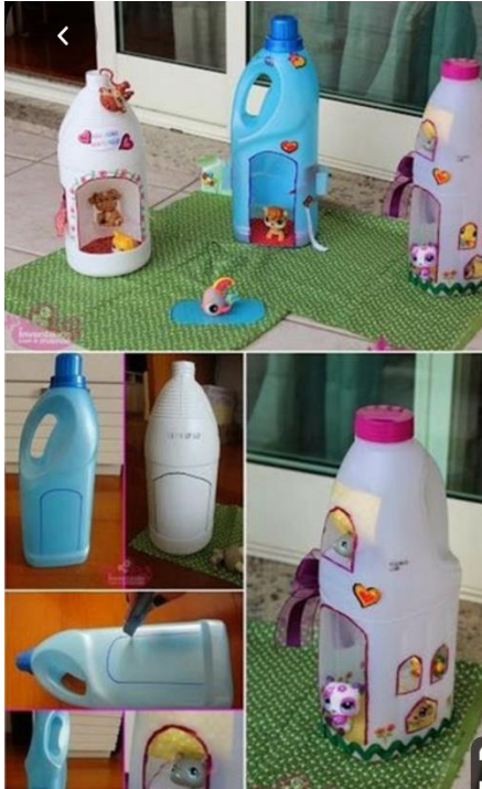
HIŠICA IZ PLASTIČNE EMBALAŽE