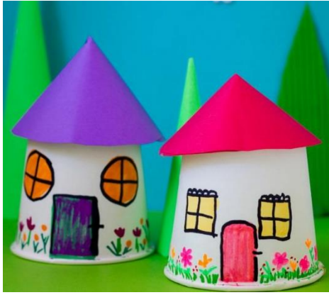
HIŠICA IZ PAPIRNATEGA ALI PLASTIČNEGA LONČKA