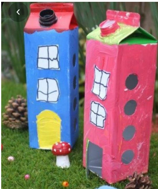
HIŠICA IZ ODPADNE EMBALAŽE (soka, mleka, itd..)

Ne pozabi pa – DOM IN DRUŽINA JE NAJVEČJA VREDNOTA. CENIMO JO. IMEJMO SE RADI!