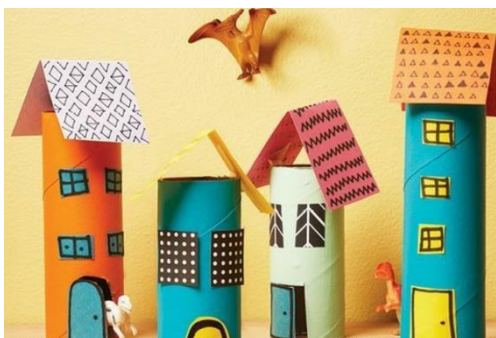
HIŠICA IZ TULCA